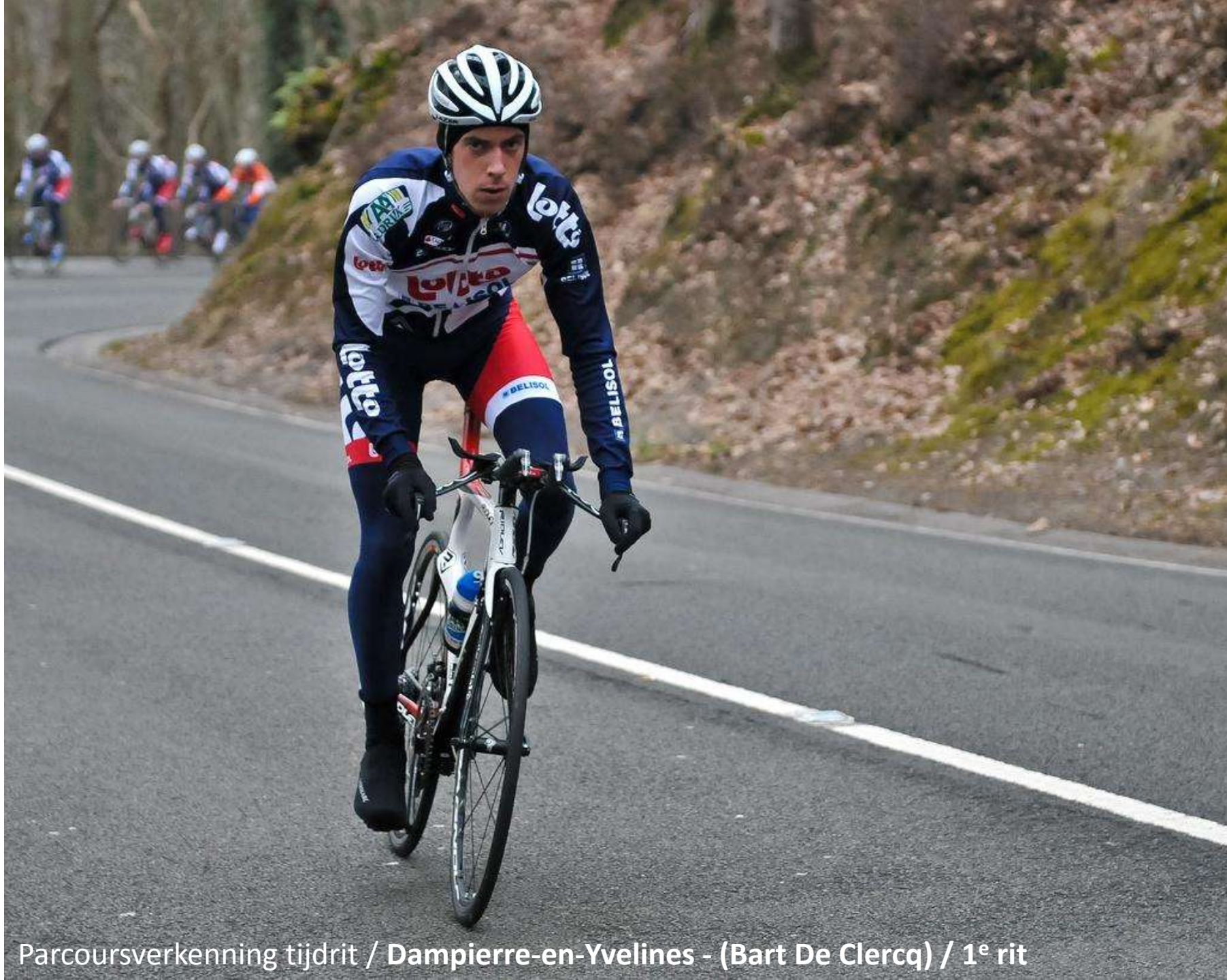
Parcoursverkenning tijdrit / Dampierre-en-Yvelines - (Bart De Clercq) / 1 e rit